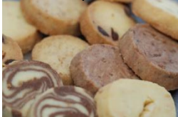
Mini-Sablé in 6 verschiedenen Aromen

10 Stück pro Sorte bei der Mini Patisserie