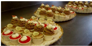
Mousse und Vermicelles in kleinen Portionen